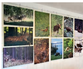
Velkoformátové fotografie Jaroslavy Pešaté v galerii M+M Hranice.