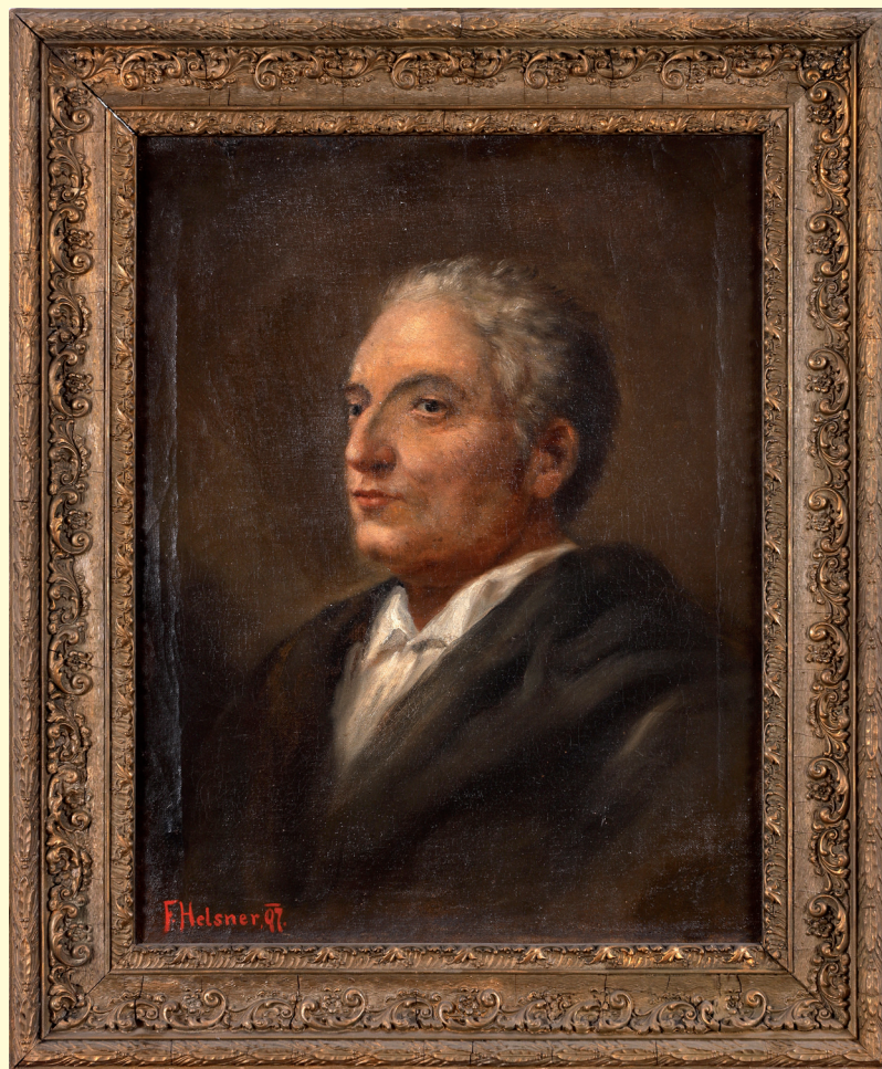
Kopie Gallašova autoportrétu z roku 1780, dílo Ferdinanda Helsnera Muzeum Hranice, foto Jan Čága

Profil Jiřího J. K. Nebeského, 2024 Foto Nela Nebeská